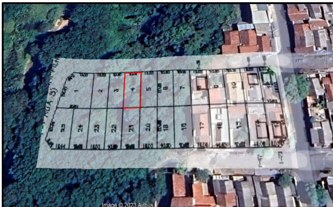
Acima localização do lote avaliando.