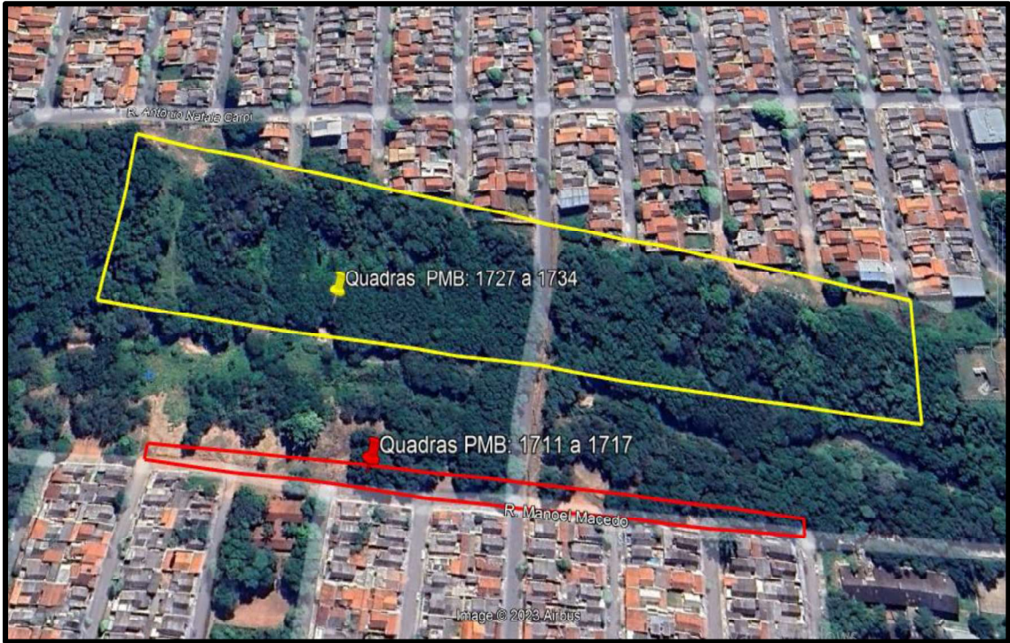
Acima localização dos imóveis.