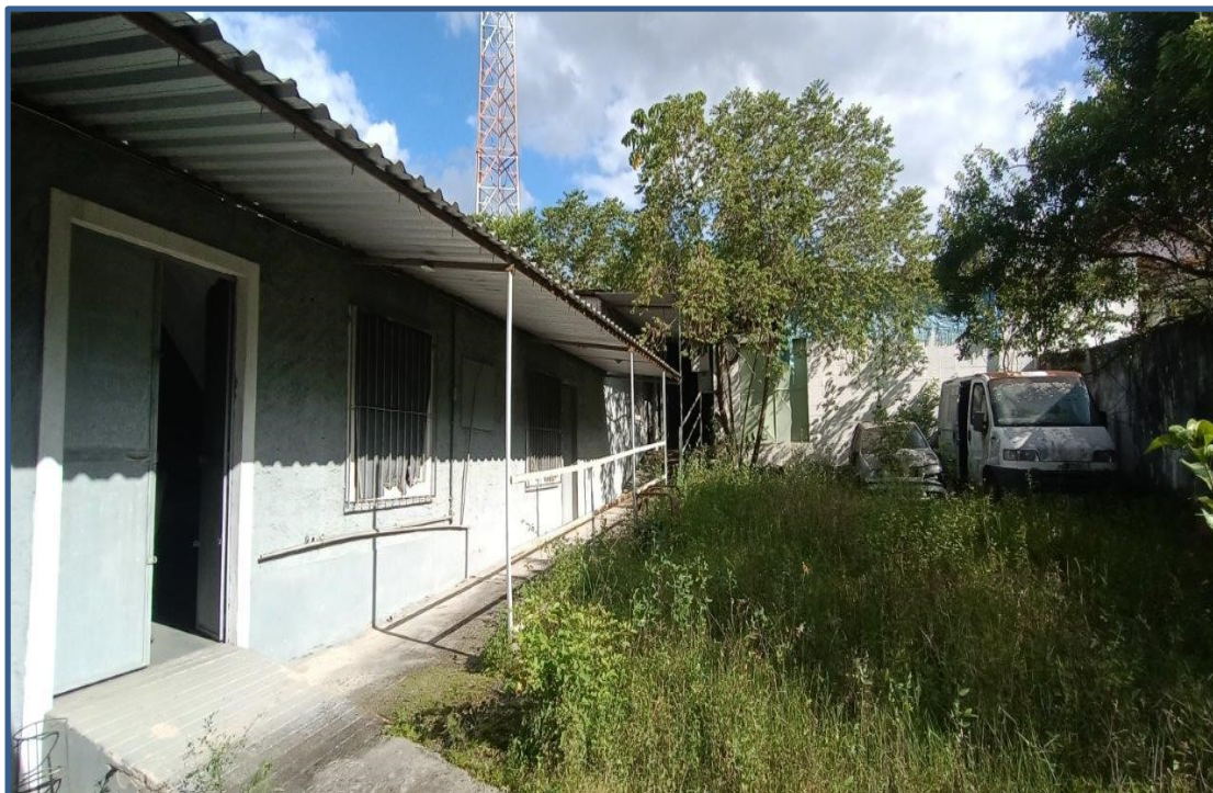
Edificação Que está dentro do imóvel avaliado