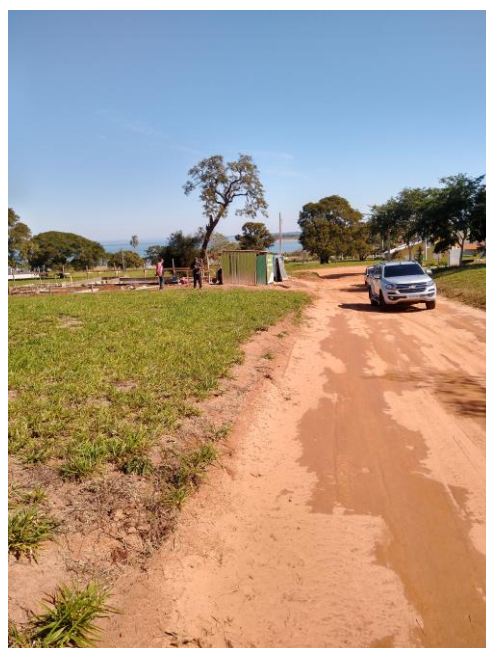
FOTO 03 – 04 - Mostrando local o lote 19, quadra DL, na Rua Córdoba.

Rua José Antunes de Oliveira, 906 – Itaí/SP Fone (14) 3761-3760 / (14) 99731-8957 e-mail: anjooli1@yahoo.com.br