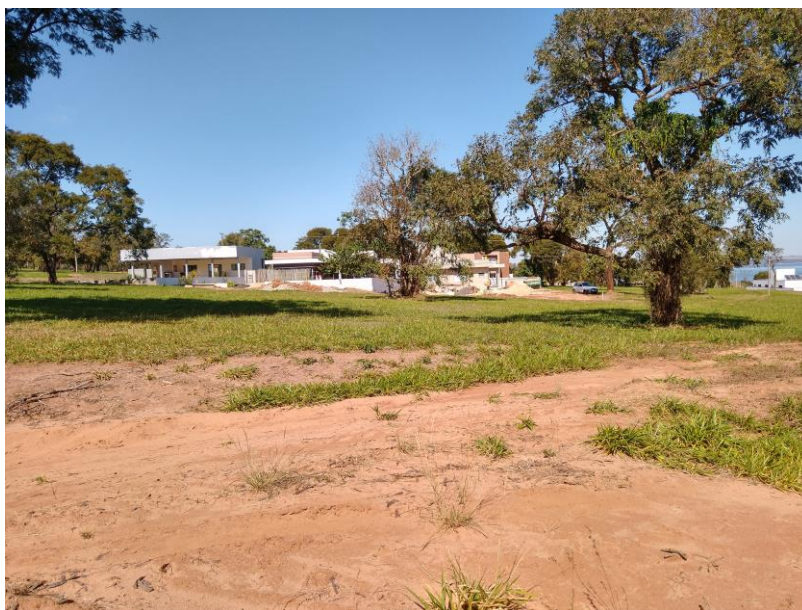
FOTO 06 – Mostrando o local do lote 19, quadra DL, sem demarcação, com construções próxima.

Rua José Antunes de Oliveira, 906 – Itaí/SP Fone (14) 3761-3760 / (14) 99731-8957 e-mail: anjooli1@yahoo.com.br