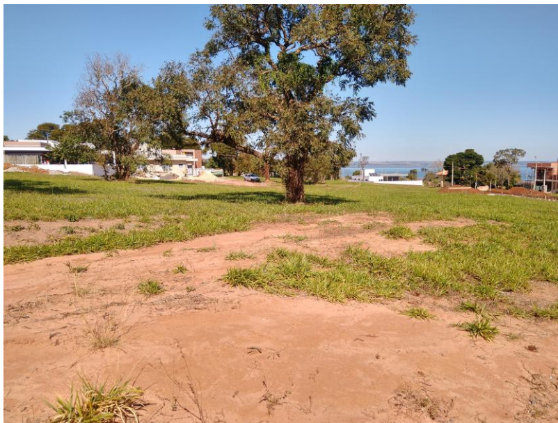
FOTO 05 – Mostrando o local do lote 19, quadra DL, sem demarcação.