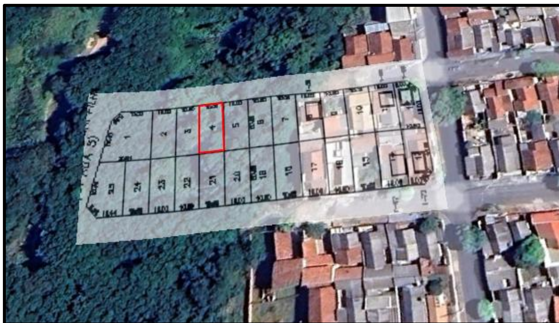
Acima localização do lote avaliando.