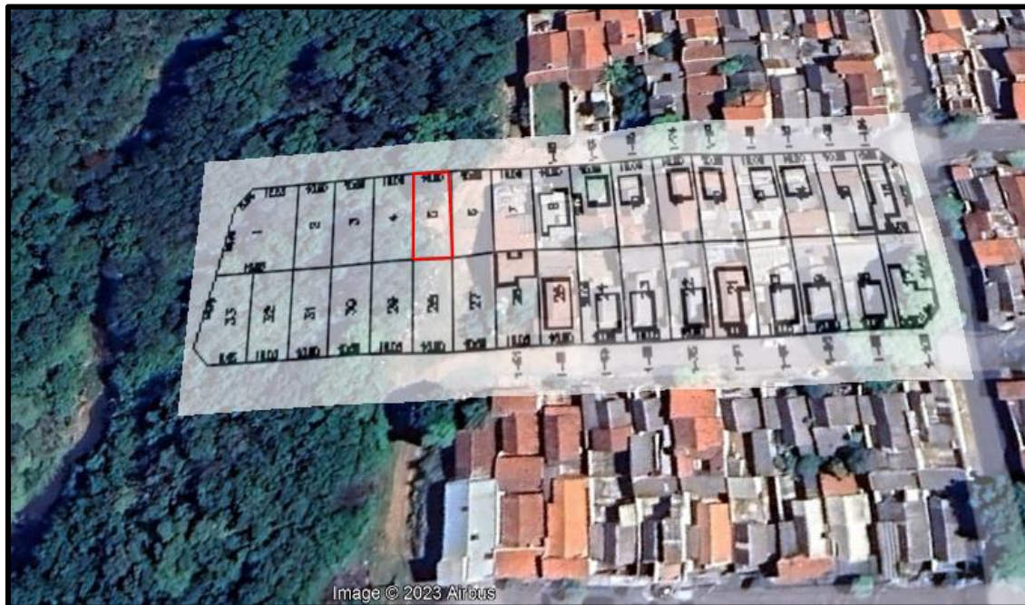
Acima localização do lote avaliando.