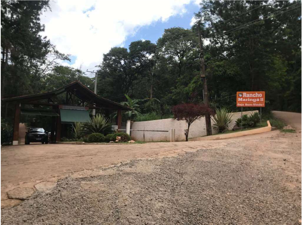
Frente da entrada do loteamento.