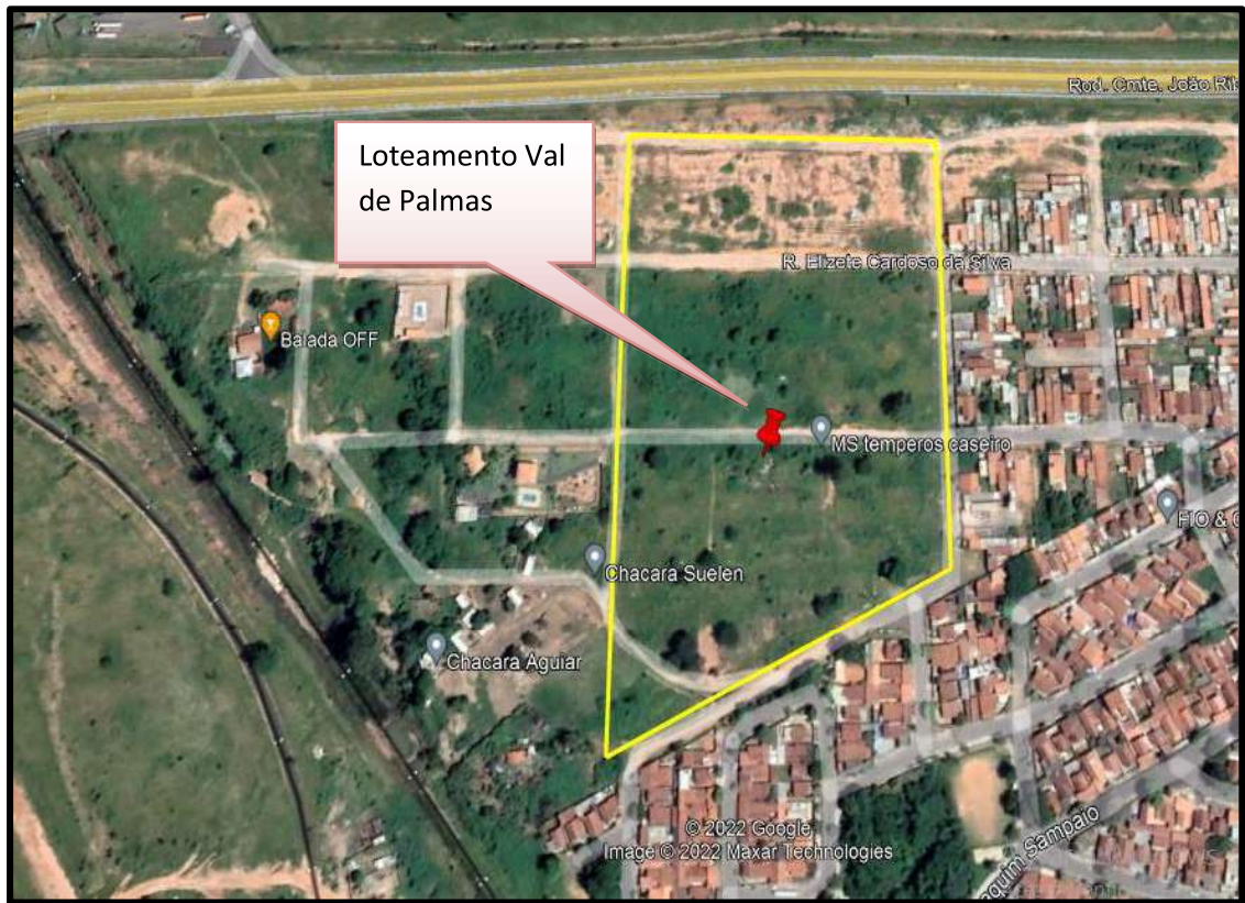
Acima localização do loteamento Val de Palmas.

Este documento é cópia do original, assinado digitalmente por JOSE HENRIQUE GUERINI COMINI e Tribunal de Justiça do Estado de São Paulo, protocolado em 21/06/2023 às 08:37, sob o número WBRU23702148191. Para conferir o original, acesse o site https://esaj.tjsp.jus.br/pastadigital/pg/abrirConferenciaDocumento.do , informe o processo 0012357-66.2018.8.26.0071 e código yjWaO0uc.