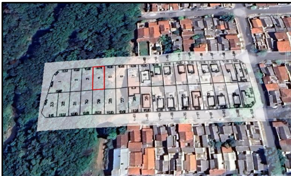
Acima localização do lote avaliando.