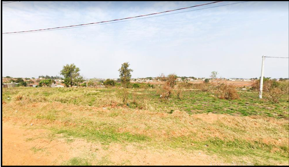
Vista interna do loteamento.