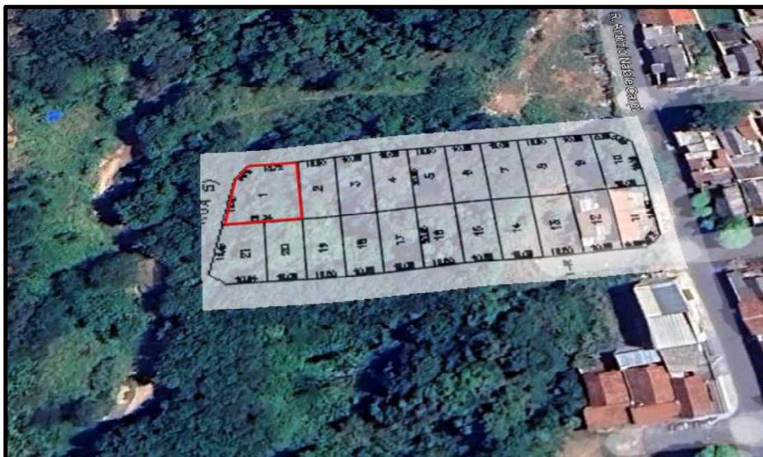
Acima localização do lote avaliando.