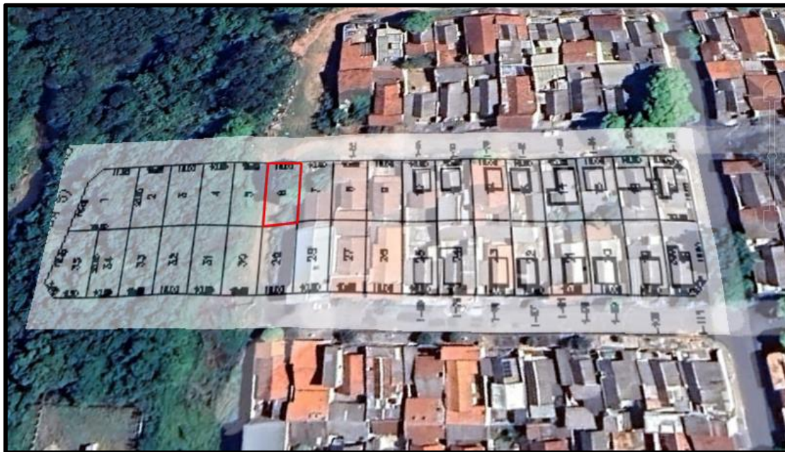
Acima localização do lote avaliando.