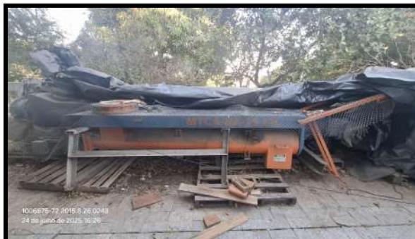
Misturador de Areia Contínuo

Finalidade da Avaliação: Apuração de Valor de Venda