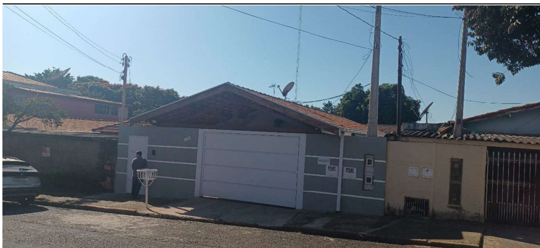
Figura 5 - Vista frontal do imóvel