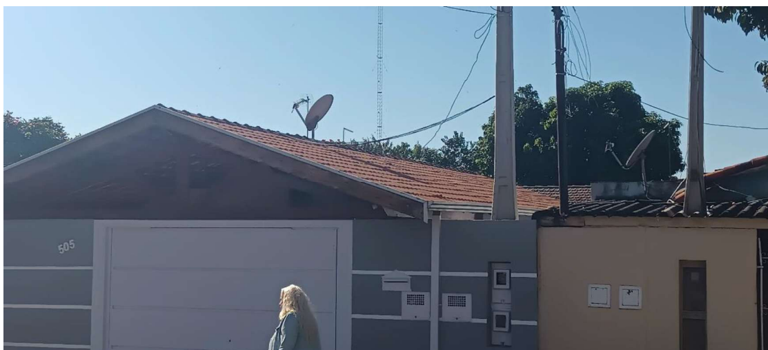
Figura 6 - Vista frontal do imóvel