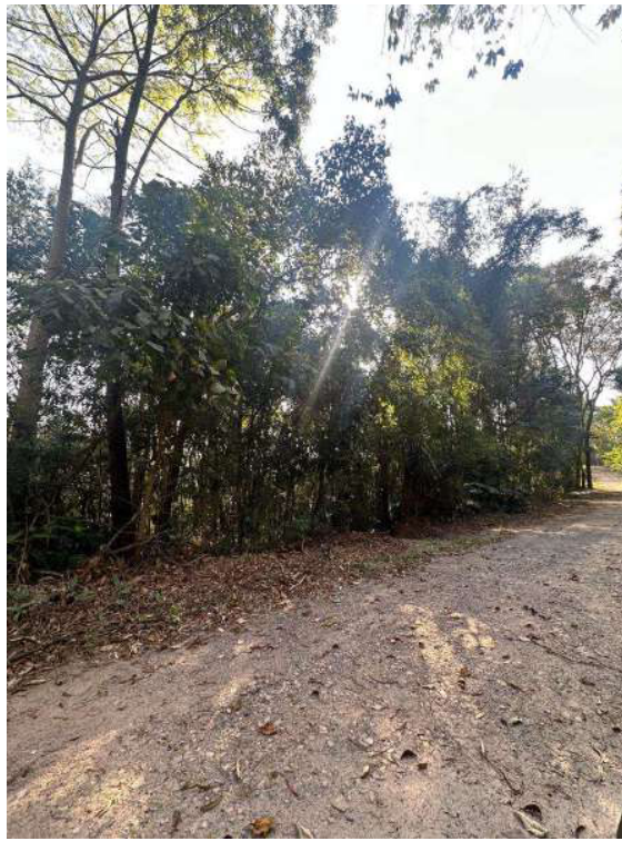
Fotografia de 29/08/2024

Vistoria - Conforme verificado em diligência, e mostrado na foto a seguir anexada, que foi tirada no local imóvel, não há nenhuma construção ou benfeitoria. Trata-se de um terreno tomado, aparentemente, por mata nativa, e com um desnível em declive, em relação à rua para qual a frente do terreno é voltada.