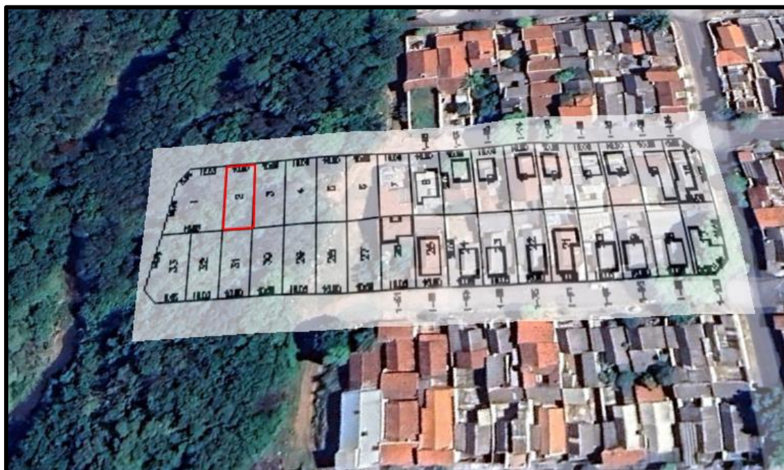
Acima localização do lote avaliando.