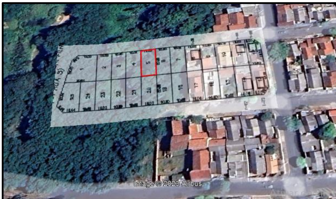
Acima localização do lote avaliando.