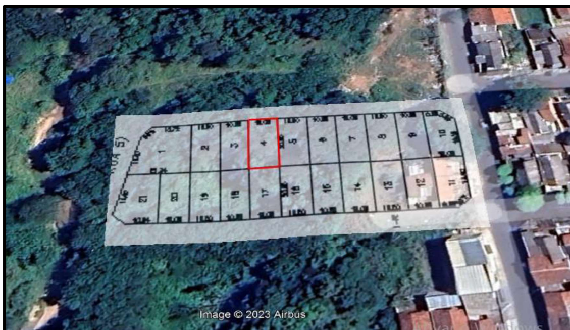
Acima localização do lote avaliando.