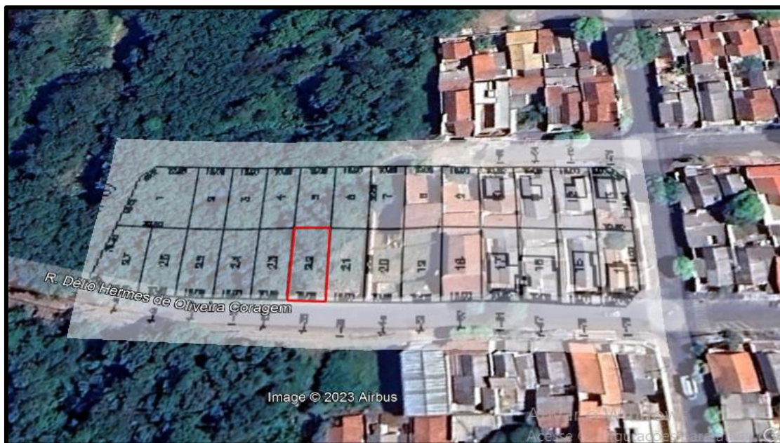
Acima localização do lote avaliando.