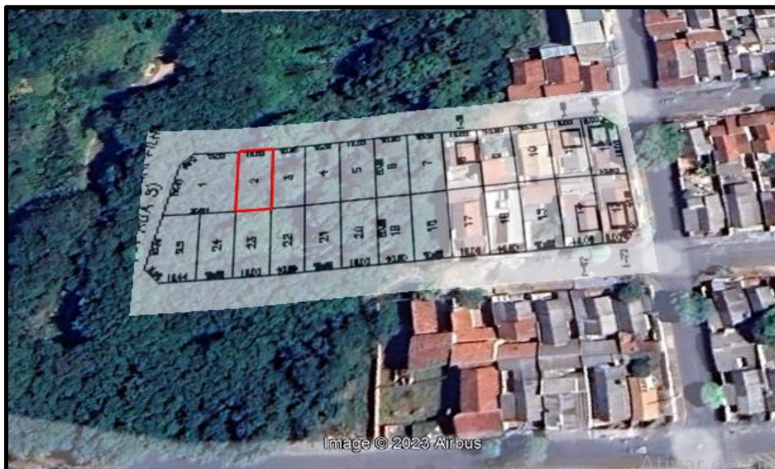
Acima localização do lote avaliando.