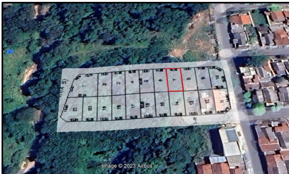
Acima localização do lote avaliando.