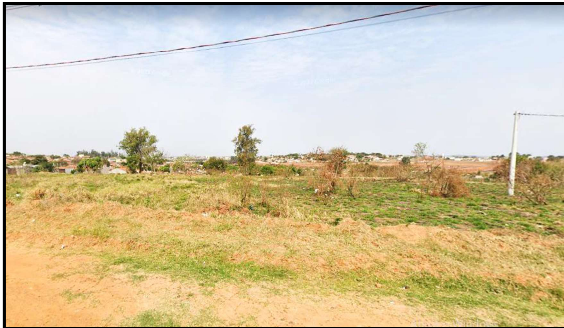
Vista interna do loteamento.