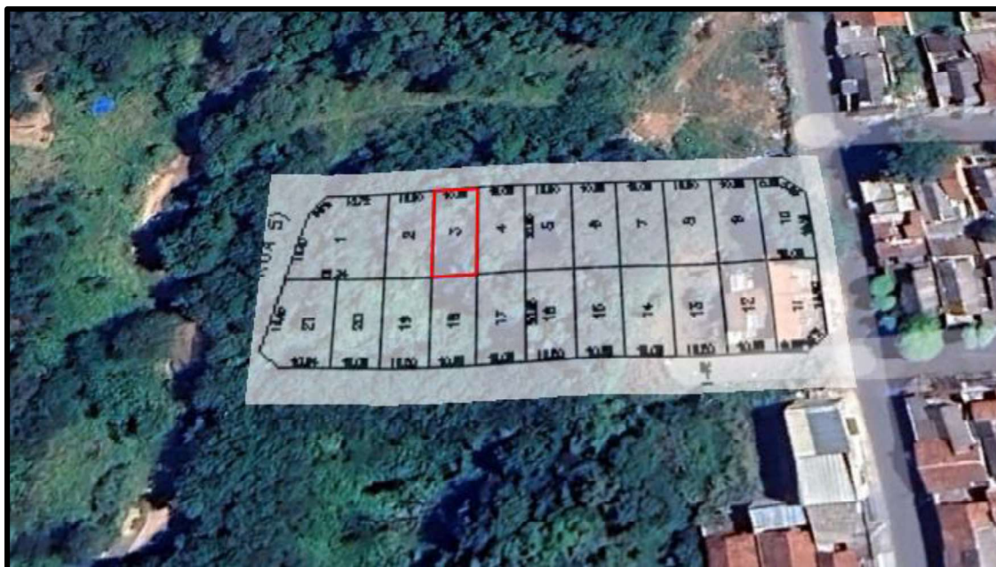
Acima localização do lote avaliando.