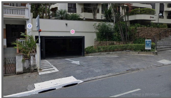
FACHADA DO EDIFÍCIO E ACESSO À GARAGEM

Nesta data concluo que o imóvel descrito foi avaliado no valor de venda de R$192.000,00 (cento e noventa e dois mil reais) , levando em consideração os imóveis referenciais pela sua localização, área construída e condições de aproveitamento, características da região, padrão do entorno, bem como a idade e tipo do terreno.