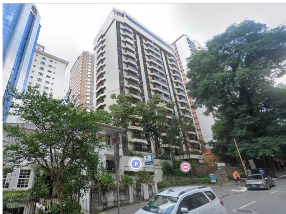
Foto da fachada

Características da vaga: Nº 49, na garagem localizada no 1º subsolo, - do "EDIFÍCIO PARK AVENUE RESIDENCE SERVICE", situado à Alameda Jaú, nº 358, no 28º subdistrito - Jardim Paulista, contendo a área total de 17,83ms2, e a fração ideal de terreno de 0,110.084%; vaga essa em lugar individual e indeterminado, com uso de garagem, numerada tão somente para fins de registro.