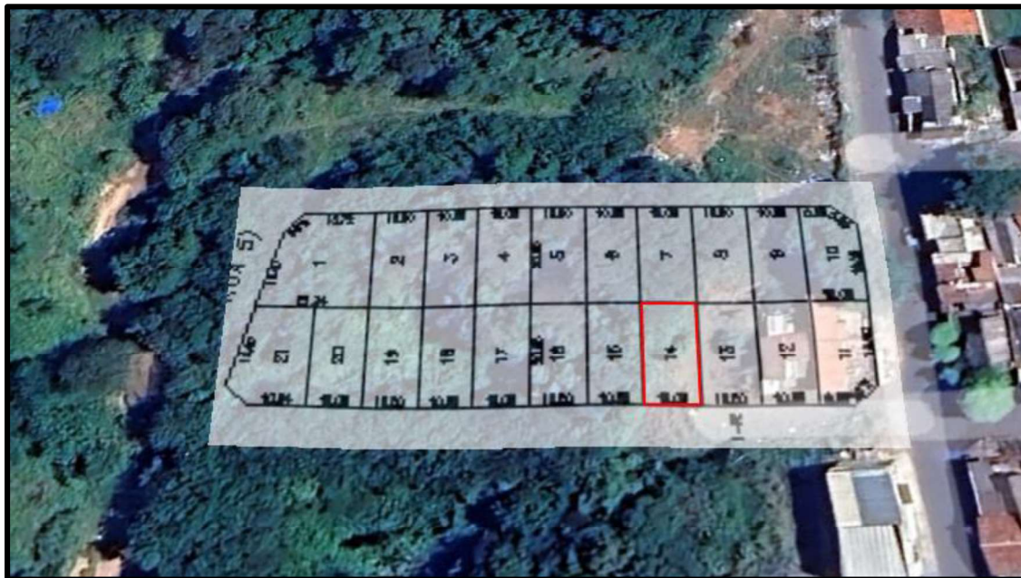
Acima localização do lote avaliando.