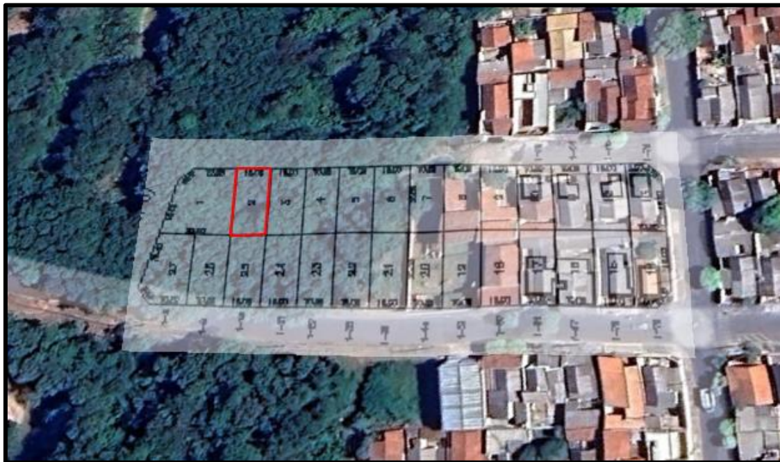
Acima localização do lote avaliando.