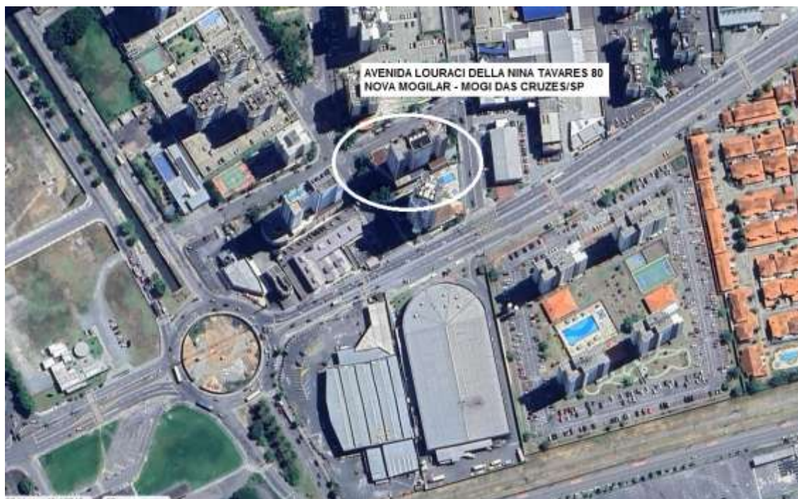
Imagem Satélite Amazonia I