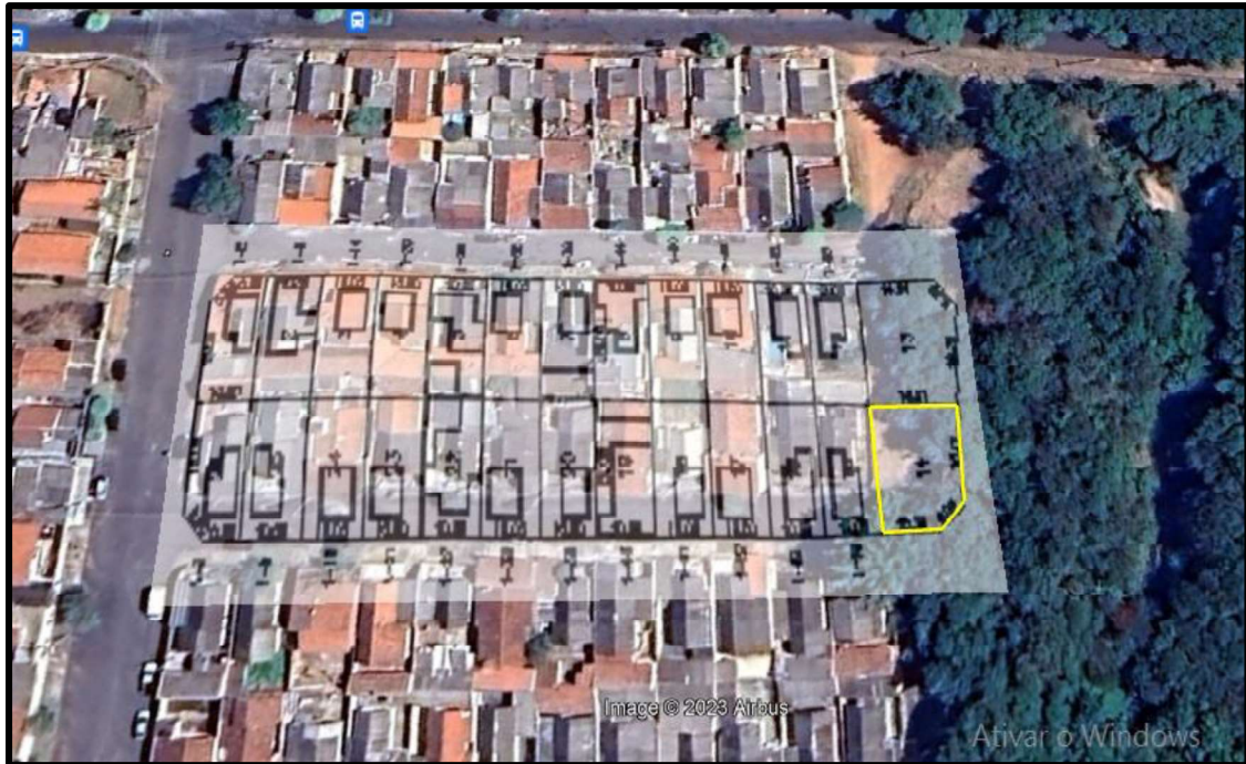
Acima localização do lote avaliando.