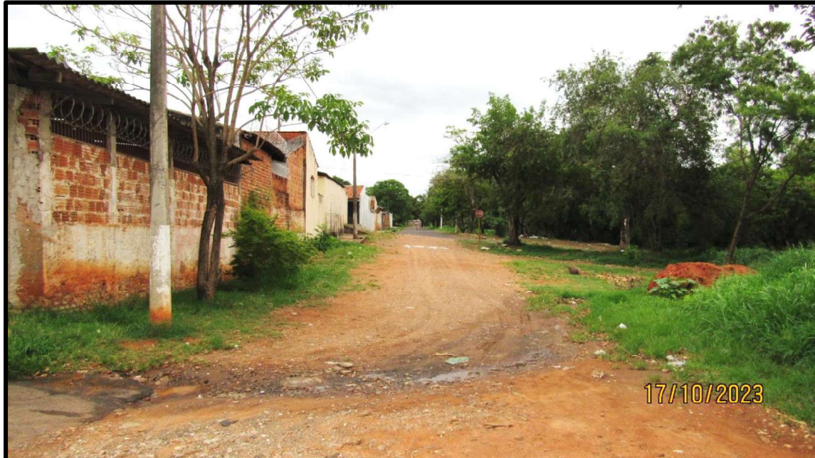
Vista interna do loteamento.