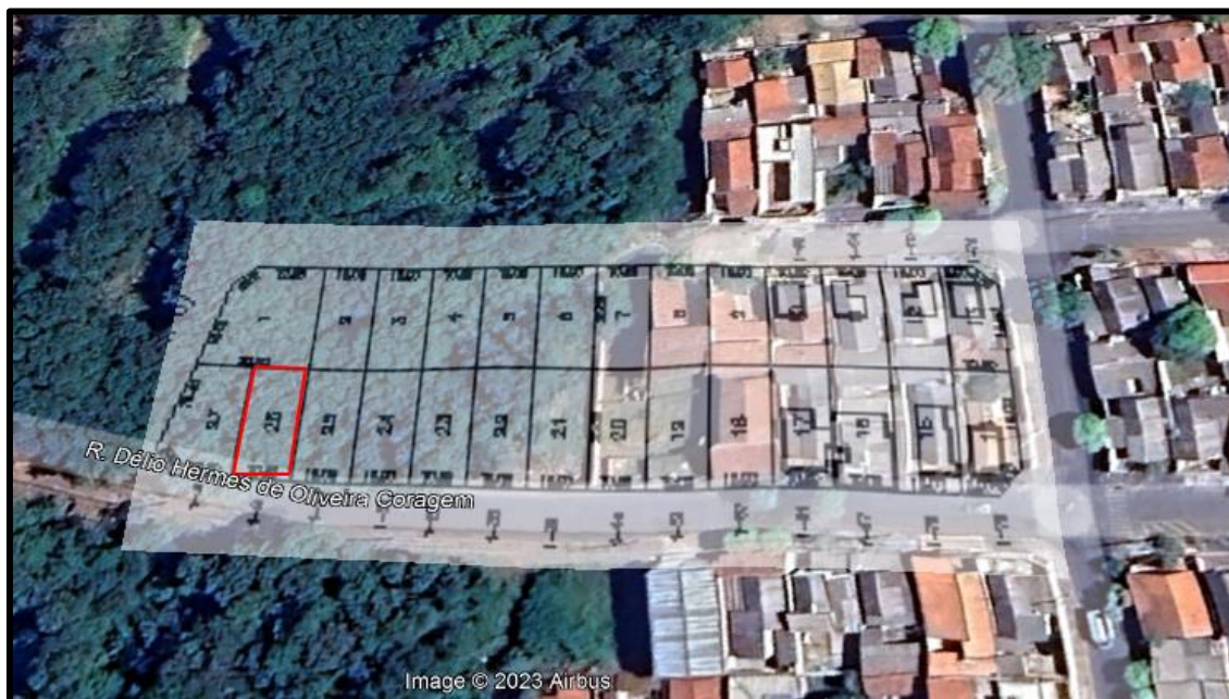
Acima localização do lote avaliando.