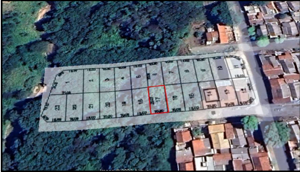
Acima localização do lote avaliando.