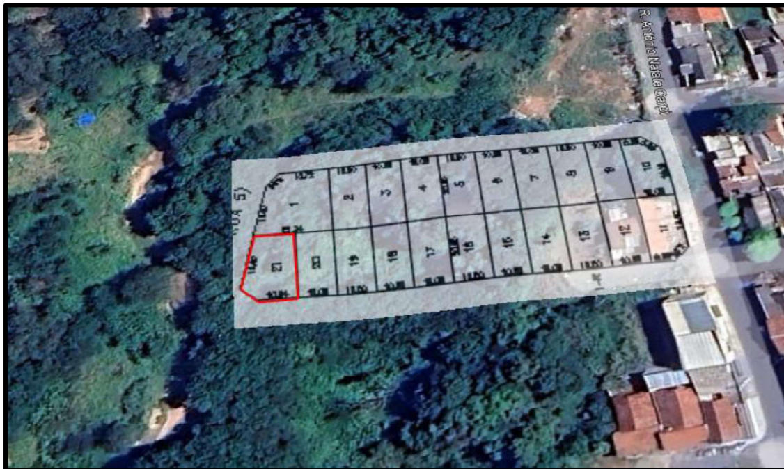
Acima localização do lote avaliando.