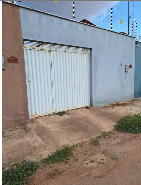
Fachada da casa