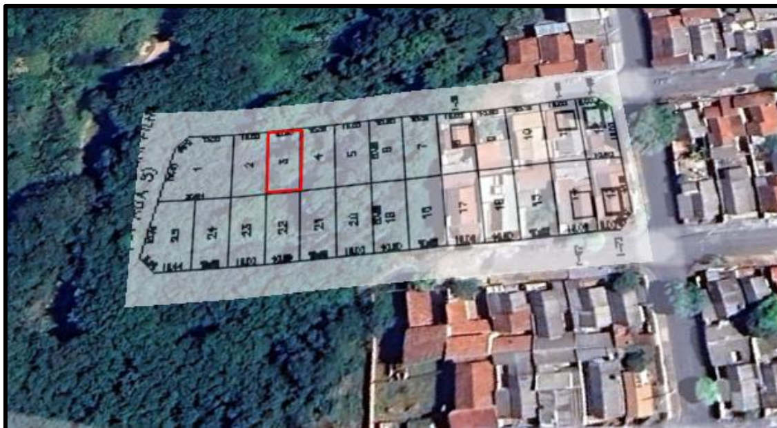
Acima localização do lote avaliando.